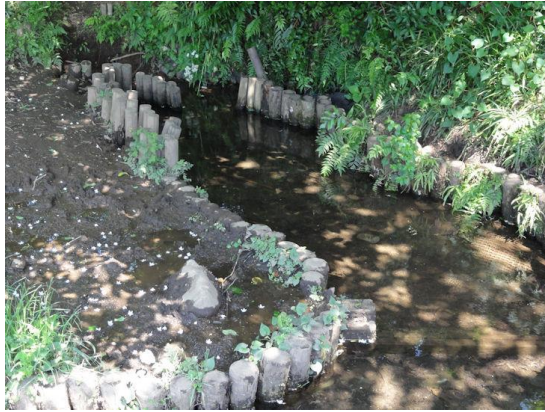
びくに八の釜憩いの森（湧水）