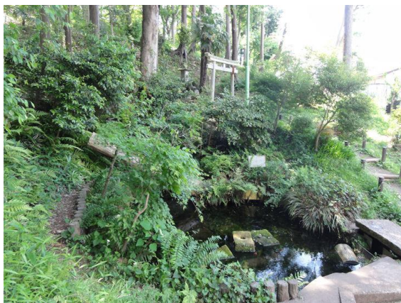
稲荷山憩いの森（湧水）