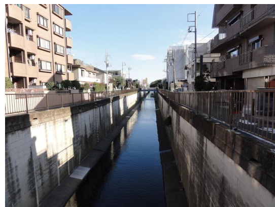
東調布公園（湧水） 呑川