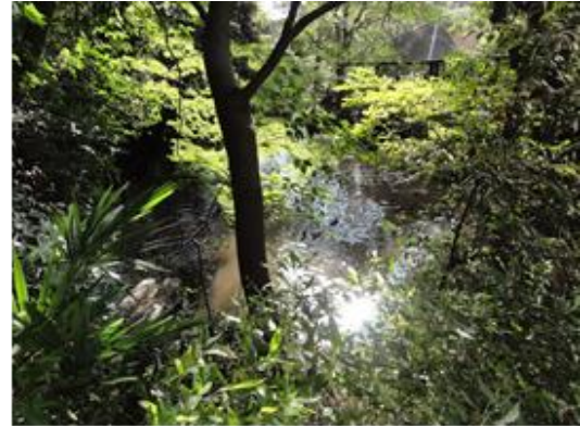
多摩川台古墳群・亀甲山古墳