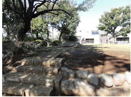
御嶽山古墳 西岡 13 号古墳