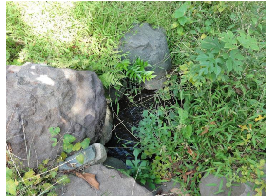
丸子川 宝来公園（湧水）今は湧水ではない？