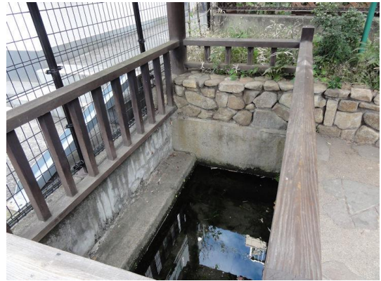
六郷用水（湧水1） 六郷用水（湧水2）井戸