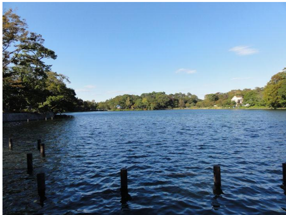
洗足池 かつてあった、泉の地図記号